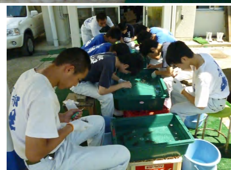
【トラフグ歯切りの様子】

噛み合いによる減耗を抑えるため、トラフグ400尾の歯切りを行いました。慣れない作業に苦戦をしましたが、なんとか作業を終わらせることができました。このトラフグは、今年5月末に(株)アーマリン近大(近畿大学)から購入し、2年栽培環境コースの生徒達が飼育してきたものです。来年の秋には魚体重1kgになるように、大切に飼育していきます。