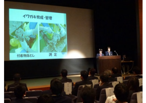
海洋科学科の発表