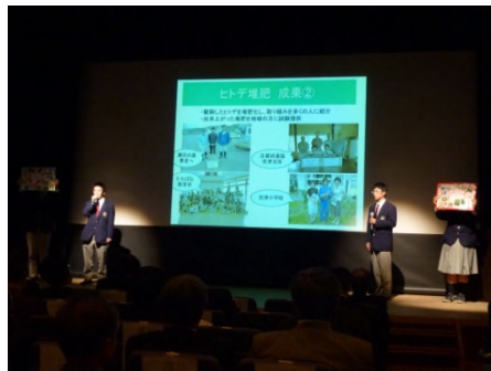
海洋技術コースの発表