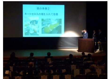
栽培環境コースの発表