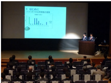
航海船舶コースの発表