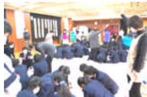
2年生百人一首大会

3月9日(金)、平成23年度の卒業証書授与式が挙行されます。今年は通学高等部3年生のみ、20名となります。