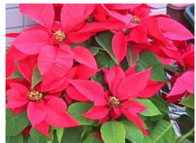
十二月の花 ポインセチア

バザーのご協力ありがとうございました！ おかげさまでたくさんの収益を上げることができました。また、持久走大会への応援もよろしくお願いいたします。