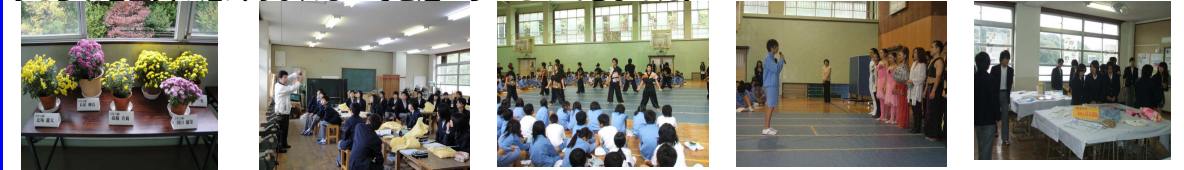
【菊作品展】 【公開授業】 【京炎パ-演舞】 【ダンスチームへのお礼】 【作品展示見学】

1校時の道徳では、学年に応じた題材を扱い、活発に意見が交流でき、たいへん充実した授業でした。公演会では「今をかがやけ 夢にはばたけ」をテーマに全員がダンスに参加したり、チャップ演奏に聴き入りたりと参加者全員が活気あふれる一時を過ごすことができました。