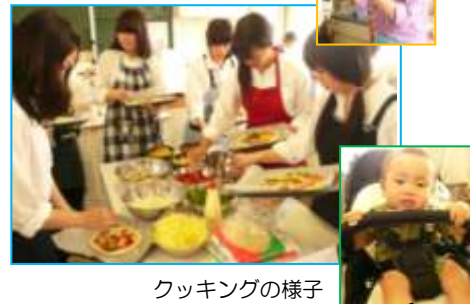
クッキングの様子