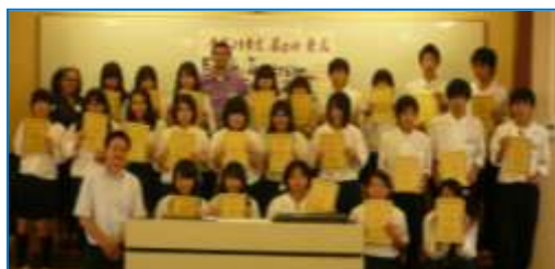
修了書を持って記念撮影

This was a good lesson for me. I will participate in the next English Immersion Camp. (2年女子) Jeff's cookie is very delicious! (1年男子)