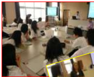
各AETの先生によるワークショップの様子