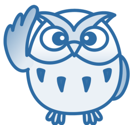
京都府総合教育センター マスコット「センタ君」