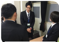
「初任者スタート」講座