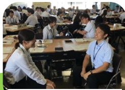
「コミュニケーション」講座