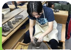
「京の伝統文化体験」講座