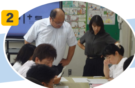
2 グループで1学期の評価を振り返り、評価の在り方を考える