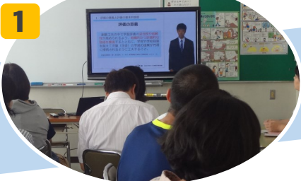
1 「道徳科に求められる評価」の動画視聴で理論を共通理解する