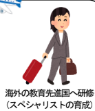
海外の教育先進国へ研修（スペシャリストの育成）