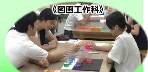
自分の作りたい色や形を 生み出す方法について学ぶ