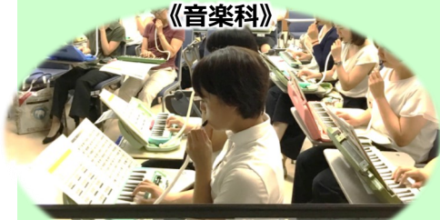
コードネームを基にした 簡単なピアノ伴奏を スモールステップで学ぶ