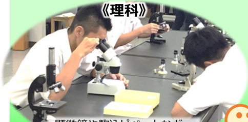
顕微鏡や駒込ピペットなど、 観察・実験に欠かせない器具の 基本的な取り扱い方を学ぶ