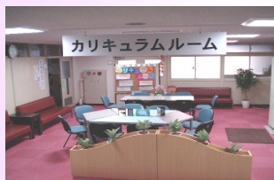
総合教育センター