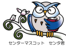
センターマスコット センタ君

平成24年7月17日(火) 第40号(通算第123号) 京都府総合教育センター TEL: 075-612-3266