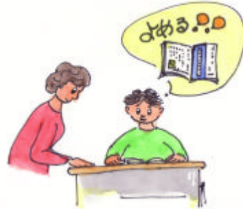
一行一行がしっかりと読める工夫