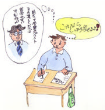
板書が苦手でも手元なら写せるよ