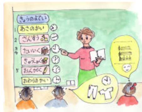
話すだけでなく見てもわかりやすい工夫