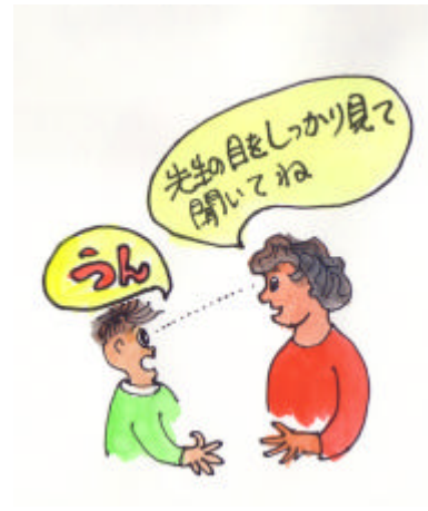
ゆっくり丁寧に話を聞き対応する