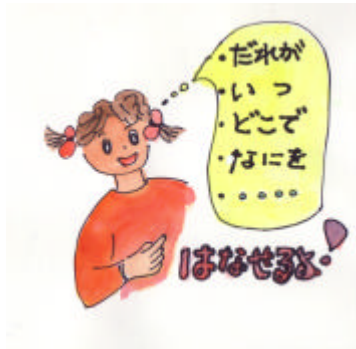
話し方をわかりやすく指示